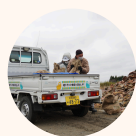
災害時に車で困らない 仕組みをつくる 『モビリティ・レジリエンス』