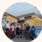
寄付車を貸し出すことで 人と地域を元気にする 『ソーシャル・カーサポート』