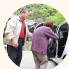
車をシェアして支え合う 仕組みを地域につくる 『コミュニティ・カーシェアリング』

東日本大震災後の宮城県石巻市で生まれた、寄付車を活用して社会貢献を行う非営利団体です。3つの活動を通して支え合いの仕組みづくりを進めています。